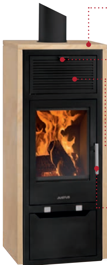
Sylt W+ Sandstein, Korpus Stahl Schwarz